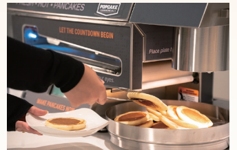
自動パンケーキマシン

メニューには下記のアレルギー物質を含む原材料を使用しています。 The menu contains ingredients that contain the following allergens.