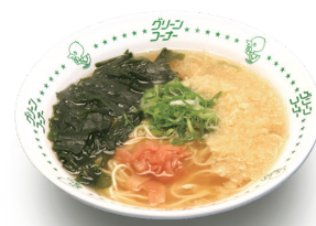
てんかけラーメン