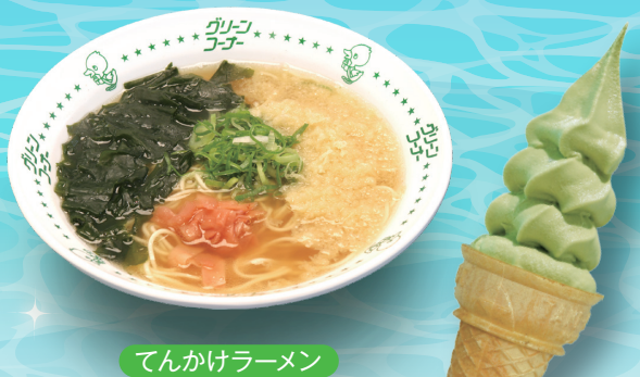
てんかけラーメン