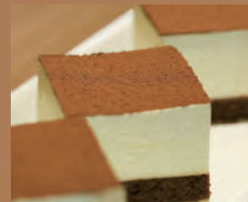
ティラミス(1カット) 350円