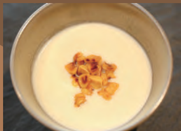
★高糖度ホワイトコーンの ポタージュスープ(1人前) ※スープのみ 400円