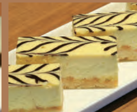
濃厚ベイクド チーズケーキ(1カット) 350円