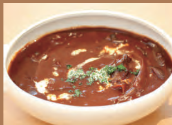
★赤ワインとフォンド・ヴォーを 使ったハヤシソース(2人前) 980円