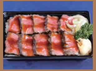
国産牛のステーキ重 2,500円