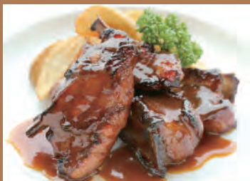
★ポークスペアリブ BBQソース (6カット)※スペアリブとソースのみ 1,600円