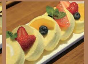
フルーツいっぱい ロールケーキ(15cm) 1,100円

※画像は全てイメージです。 ※食材の入荷状況により内容が変更になる場合がございます。予めご了承ください。 ※掲載商品は、予告なく販売を中止、または一部変更する場合がございます。