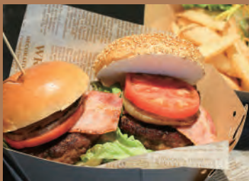
照り焼きチキン&グリル野菜の ハンバーガー (彩サラダ・フライドポテト付き) 1,500円