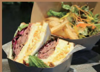
国産ローストビーフのサンドイッチ (彩サラダ・フライドポテト付き) 1,500円