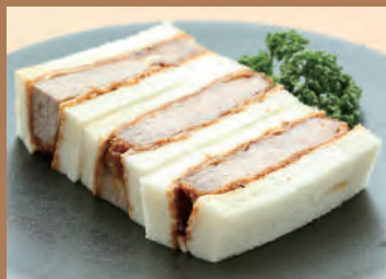
和歌山産梅豚のロースカツサンド (1人前) 1,000円