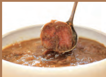
★国産牛がごろっと入った ホテルカレーソース(2人前) 980円