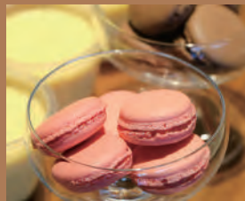
マカロン イチゴ&チョコ(2個入り) 250円