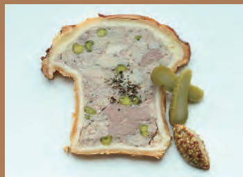
★鴨胸肉とフォアグラ ビスタチオの パテアンクルート(2カット) ※パテアンクルートのみ 1,600円