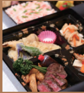
雅(みやび) (二段弁当) 5,000円