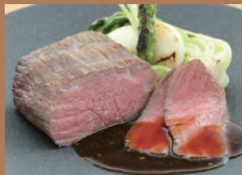
★国産牛のローストビーフ(200g) ※ローストビーフとソースのみ 2,300円