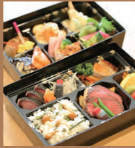
彩(いろどり) (二段弁当) 3,500円