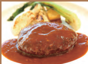
★国産牛を使った旨味たっぷりの 煮込みハンバーグ(180g) ※ハンバーグとソースのみ 1,000円