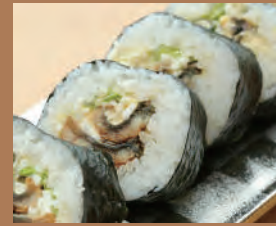
鰻タルタル巻き(1本) 900円