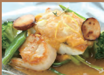
鯛とホタテのスケルトン包み 燻製バターと香味野菜の ビューレ 香草のアロマ(1人前) 1,800円