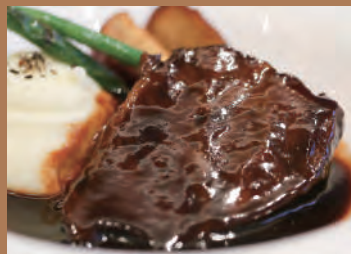
★国産牛頬肉の赤ワイン煮込み(100g) ※頬肉とソースのみ 1,800円