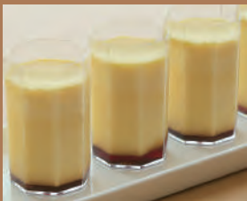
なめらかプリン(1個) 200円